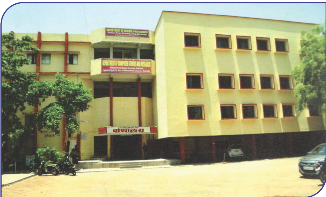
Library Building & Post Graduate Department of Science