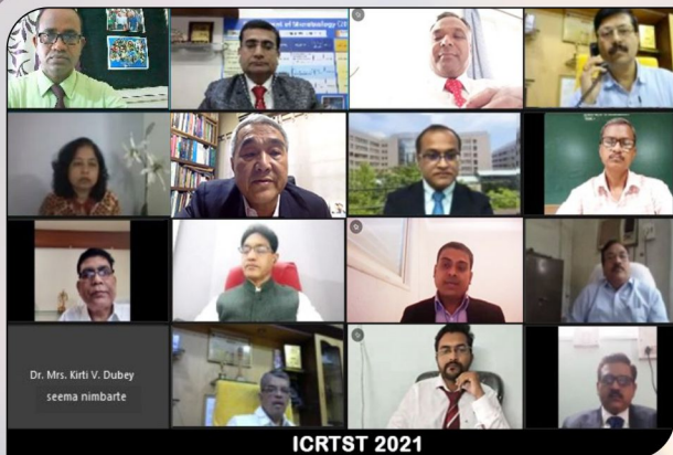
Honourable Guest at Virtual International conference on Recent Trends in Science and Technology